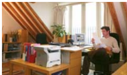
Realizzazione compatta ed elegante