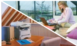
Flessibilità ancora più grande con la stampa wireless opzionale