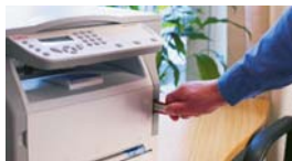
Migliore condivisione informatica grazie alla porta USB aggiuntiva